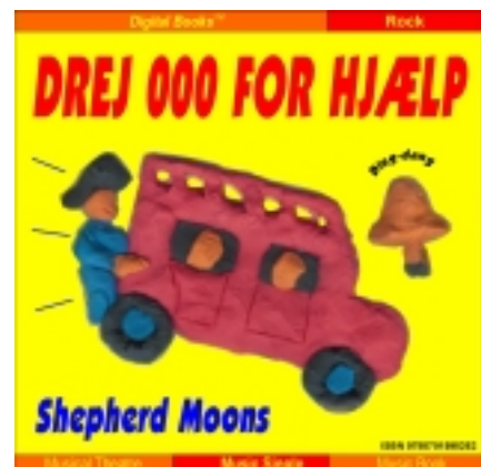
Single med Shepherd Moons udgave af Drej 000 for hjælp